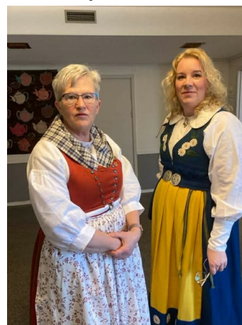
Två nöjda ordförande