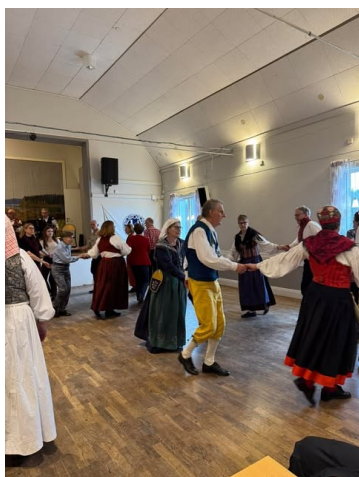
Kul att dansa