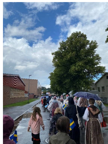
4 Regnig parad genom Lerum

Innan det första tåget hann gå började det dock spöregna och paraden blev försenat. Till sist fick ändå tåg ett och två gå i regnet. Som tur var slutade det regna just innan vårt tåg skulle gå! Det började dock regna lite grann igen när vi nästan var framme i arenan som var vår slutdestination. Det var dock så nära dit att det inte gjorde något. När vi kom in på arenan fick vi se alla länders vackra uppträdanden (de nationella uppvisningarna), innan det var Sveriges tur allra sist. Vila fanns inte tid för i programmet för sedan var det återigen dags för Tillsammans i Norden. Vi fick däremot gå därifrån tidigt denna gång för att hinna till konserten med "Spöket i Köket" som var senare på kvällen. På grund av trötthet missade jag dock konserten denna gång. De andra berättade dock att det var en fantastisk konsert. När jag sedan kom för att dansa till fridansen med Spöket i Köket kunde jag hålla med om att de var väldigt bra! Både den stora gruppen och mellangruppen dansade och hade det fantastiskt roligt hela kvällen! Spelet slutade allt för tidigt för vår smak och det blev i stället fridans och nattdans där deltagarna tillsammans bestämde vilka danser som skulle dansas. Det blev ofta danser på ring, något som jag själv tycker är väldigt roligt. Det blev en sen kväll då nattdansen inte slutade förens vid 02.00.