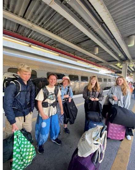
Redo för avresa från Uppsala C