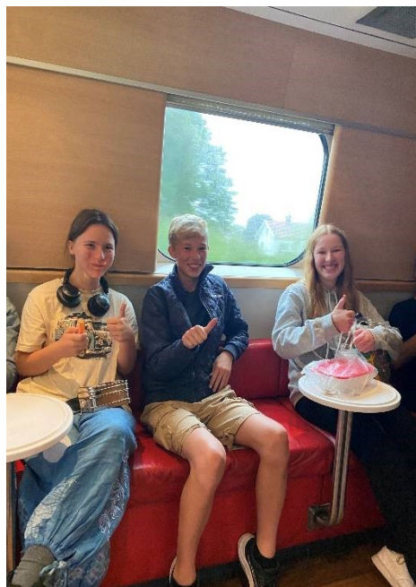
2 Sista biten av resan i bistrovagnen

Idag var gick vi parad genom Lerum. Vi hade även en nationell uppvisning i Lerums arena så dagen började med att öva inför uppvisningen tillsammans med de andra deltagarna från Sverige. Trots nya danser för de yngre busarna gick det väldigt bra och repetitionen gick snabbt och smidigt förbi. Vi lämnade sedan de andra svenska deltagarna för att öva inför vår egen uppvisning som skulle vara på lördagen. Medan de yngre hade lekpaus gick vi äldre vidare till Tillsammans i Norden. Efter det behövde vi snabbt äta och göra oss i ordning för paraden runt Lerum. När dräkterna var på var vi redo att gå i det sista av de tre paradtågen