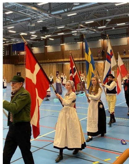
5 Fanborgen bärs ut på avslutningen. Norges flagga har nu kommit efter att den fastnat i tullen inför invigning-

Precis som igår skulle idag bli en fullpackad dag för oss. Vi började dagen kl. 09 på Tillsammans i Norden med den sista trängen innan genrepet inför avslutningen. Därefter blev det en snabb lunch och ombyte till dräkt inför vår PR-uppvisning på stan. När vi alla var redo tog vi bilder på hela gruppen och for sedan i väg till Bagges torg för uppvisning. Mellan-bus hade ont om dansare till sin uppställning och några av oss äldre (b.la jag) var med och dansade deras danser. Uppvisningen gick hur bra som helst! Vi i Stor-bus dansade in en och en på Jessikapolka och fortsatte med schottisen "Börsrasen". Avslutningsvis dansade vi en egenkomponerad schottis. Eftersom vi strax efter uppvisningen skulle ha genrep inför avslutningen, samt själva avslutningen, tog vi inte av oss dräkterna förens långt senare på kvällen. Innan genrepet dansade vi b.la. Färöiska kvaddanser, där man går i ring och sjunger visor. Sedan var det dags för genrepet inför avslutningen som gick snabbt, men det var dock otroligt varmt i dräkt! Vi behövde sedan äta middag snabbt innan samlingen inför avslutningen. Medan de äldre dansade tog den yngre gruppen den sista möjligheten att vara i pysselrummet under eftermiddagen. Avslutningen av Barnlek 2023 var fantastisk!