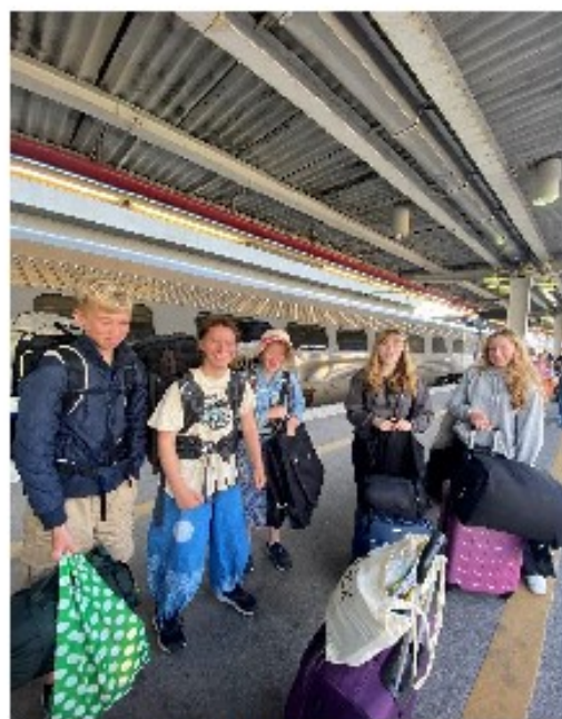
1 Redo för avresa från Uppsala C