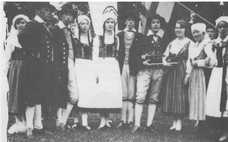
Gillet uppställt för fotografering

Vinsten från Byarådets arrangemang delades lika mellan föreningarna. Rådet upphörde i början av 1970-talet. Idrottsföreningen och Intresseföreningen turades sedan om att arrangera festligheterna. Föreningen får då behålla hela vinsten själv. Luggudegillet hade sin ekonomi säkrad genom uppvisningar. SDUK har upphört.