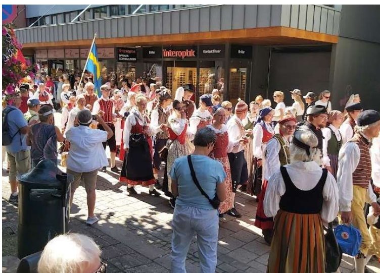
Paraden genom Arendals centrum

När vi kommit åter till Kanalplassen fick vi ett smakprov på hur ett traditionellt "setesdalsbryllaup" firas. En otroligt vacker brud och brudföljet spelade, sjöng och visade några danser.