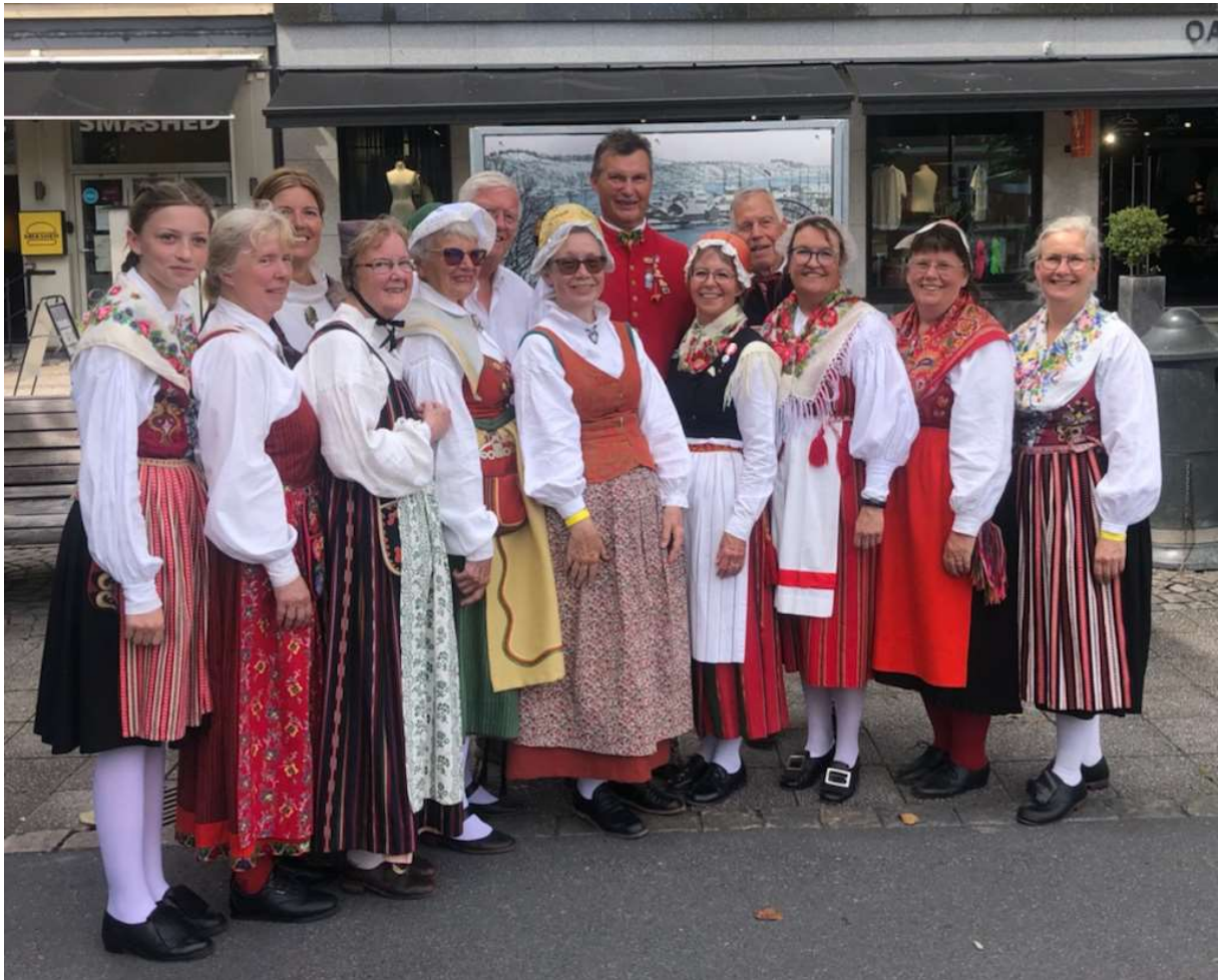
Det utökade Dalalaget