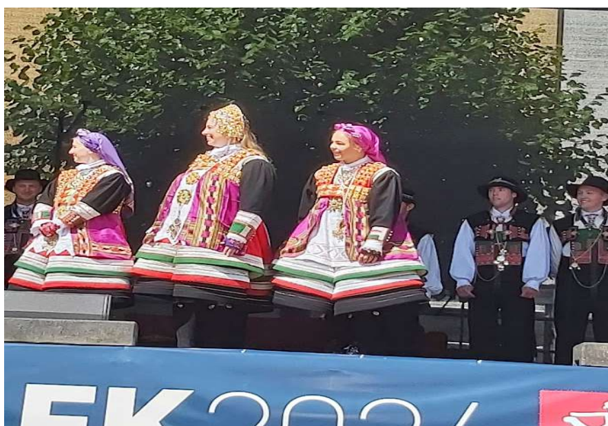
Brud med följe, "setersdalsbryllaup"

När vi kommit åter till Kanalplassen fick vi ett smakprov på hur ett traditionellt "setesdalsbryllaup" firas. En otroligt vacker brud och brudföljet spelade, sjöng och visade några danser.