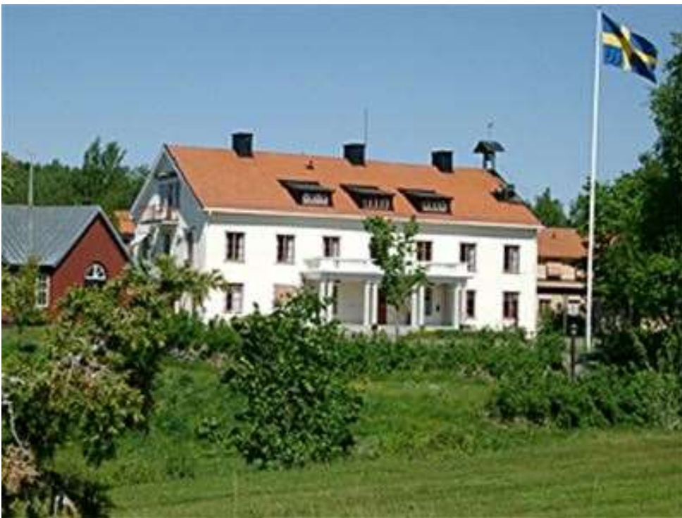
Stiftsgården Rättvik.

PS Dansledarutbildning del 2, blir den 22 – 23 mars 2025. DS