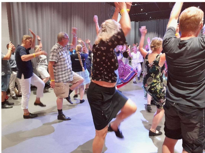
Finsk "vild tuppdans"

Lördag 20 juli. Dagen inleddes med en liten sovmorgon innan dräkten skulle på och bussen till centrum avgå kl 10.45. Väl framme blev det uppställning för parad genom centrum. Först i paraden åkte häst och vagn med ett brudpar från Setesdalen, sedan kom flaggor och ca 1 500 dräktklädda dansare från hela Norden. Längs paradvägen stod våra musiker från olika länder och spelade.